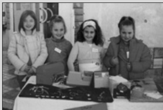
adorno que ponen a la venta. Con el dinero recaudado lo enviarán a un colegio de Perú. Todo ello organizado por Cáritas de Alborea.