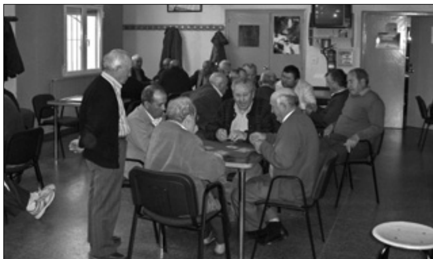
CONVOCADAS AYUDAS PARA CLUB DE JUBILADOS Y ASOCIACIONES DE MUJERES