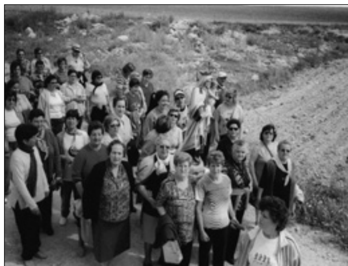
1 DE MAYO ROMERÍA A LA CAÑADA