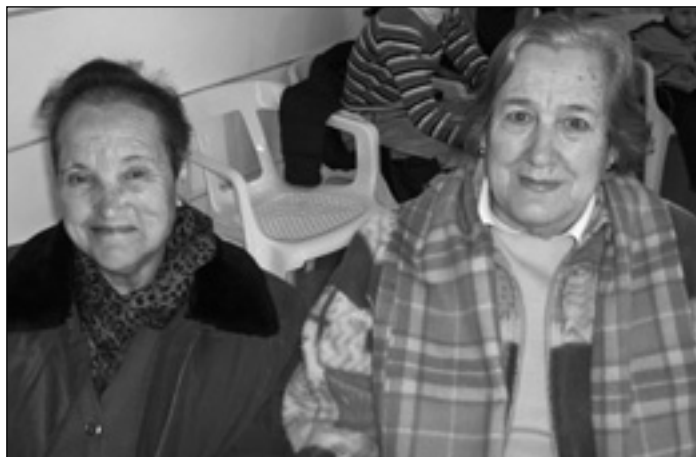
RENOVACIÓN DE D.N.I.

N.º 111. MARZO/ABRIL 2008. 1,00 EUROS. CONCEJALÍA DE CULTURA - UNIVERSIDAD POPULAR - AYUNTAMIENTO