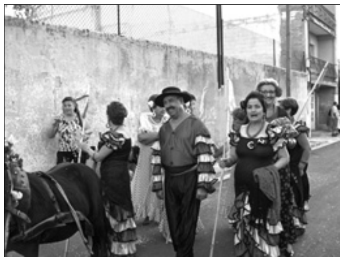
FORMADA LA COMISIÓN DE FIESTAS 2008