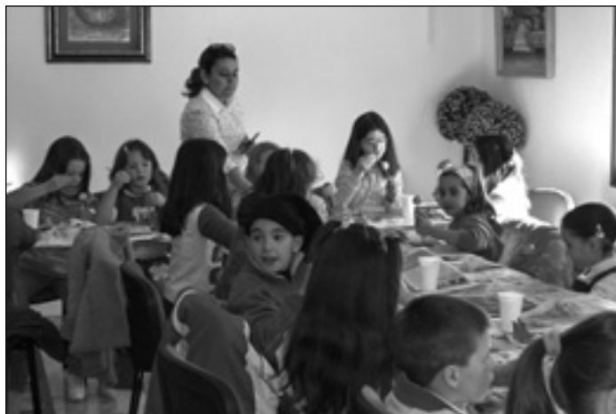
SEMANA DEL LIBRO EN ALBORES